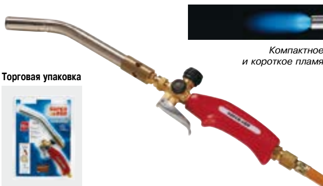
Компактное и короткое пламя