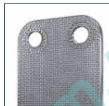
Инновационная конструкция, основанная на микроканальной технологии