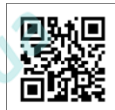
Для получения более подробной информации о технических характеристиках сканируйте QR код.