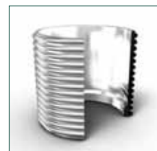
Гибкое соединение «два в одном»